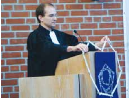
Glaube mit Herz

Im Gottesdienst am 26. März in der Stephanuskirche wurde die neue Altarbibel eingeführt.