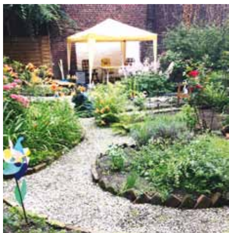
Hinterhof Schreiber, Augustastraße

12 Uhr, 14 Uhr und um 16 Uhr ab dem Erzählcafé Altes Backhaus an der Lange Straße 30 in Hagen-Wehringhausen (auch Ausgabestation der Folder). Anmeldungen sind nicht erforderlich.