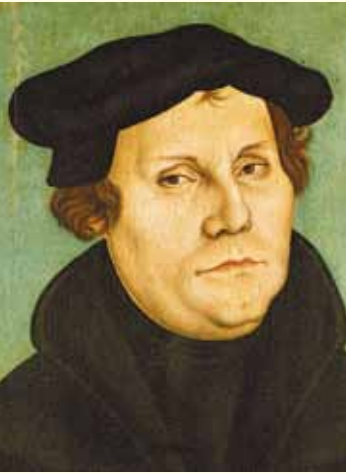
Martin Luther (aus der Werkstatt Lucas Cranachs des Älteren, 1529)

Und jeder der vielen großen und kleinen Herrscher hat seinen eigenen Kopf, seine eigenen Interessen.