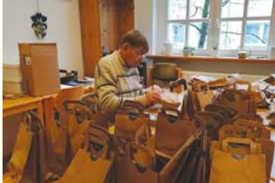
Für eine Andacht zu Hause wurden Tüten verteilt mit einer Predigt und einer Kerze.

Zeitweise war Musik von der Orgel zu hören, wieder zu einer anderen Zeit sang eine Sopranistin von der Empore und ließ auch auf diese Weise weihnachtliche