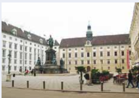
Innenhof der Wiener Hofburg