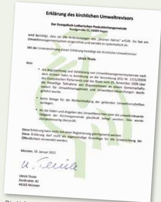
Die Urkunde zur Revalidierung

wird in beiden Gemeindezentren fast ausschließlich Kaffee, Tee und Wein, Schokocreme, Kekse, Schokolade und Konfekt aus fairem Handel genossen. Wir kaufen Lebensmittel möglichst regional, wie den Apfelsaft von Hagener Streuobstwiesen und das Mineralwasser aus der Rombergquelle in Dortmund. Wir verwenden möglichst Fleisch von glücklichen Schweinen von Bauer Korte aus Menden. Die Weihnachtsbäume kommen von Gut Kuhweide in Hagen, Blumen häufig aus dem Garten oder aus fairem Handel.