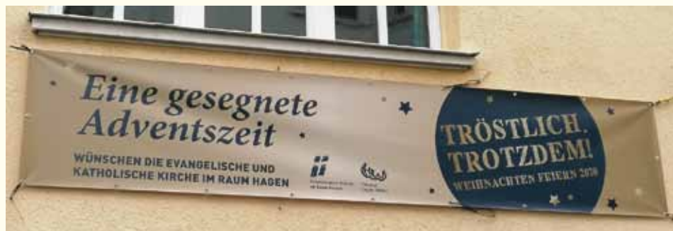
Evangelischer Kirchenkreis und katholisches Dekanat haben auf Bannern mit dem Motto „Tröstlich. Trotzdem!“ zu Advent und Weihnachten begrüßt.

Wir hoffen, dass die Infektionswerte so weit sinken, dass bald wieder Gottesdienste und Veranstaltungen mit Menschen stattfinden können.